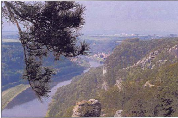
Landschaft pur: Elbtal, Elbsandsteingebirge – landschaftliche Schönheiten, für die Anna Skrainka-Schilling kaum Zeit gehabt haben dürfte.

Auf den Spuren der Vergangenheit: Eine ungewöhnliche Reise nach Hamburg